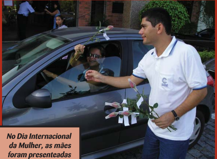
No Dia Internacional da Mulher, as mães foram presenteadas com rosas vermelhas

Leia os trabalhos de alguns alunos da Turma 63, cuja proposta foi uma homenagem à mulher, valendo-se de uma poesia.