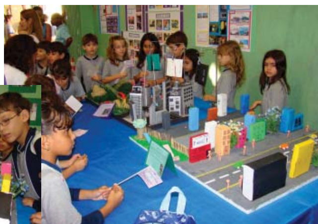
Durante a Semana Cultural, em setembro, os alunos que participam do projeto de Educação Ambiental mostraram seus trabalhos sobre o impacto ambiental

O projeto de Educação Ambiental teve culminância durante a VII Semana Cultural, que aconteceu de 08 a 13 de setembro. Na ocasião, os estudantes realizaram campanhas de conscientização sobre reciclagem e coleta seletiva do lixo, além de expor os trabalhos realizados para a Feira. Um exemplo foi a Campanha Pátio Limpo, desenvolvida pelos alunos do 3º ano do Ensino Fundamental. Também foram expostos brinquedos e objetos feitos a partir de sucatas.